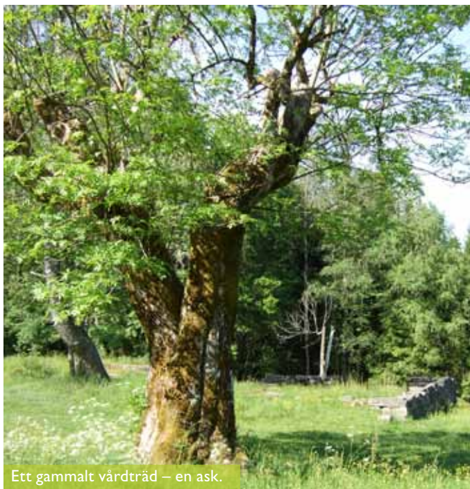
Ett gammalt vårdträd – en ask.