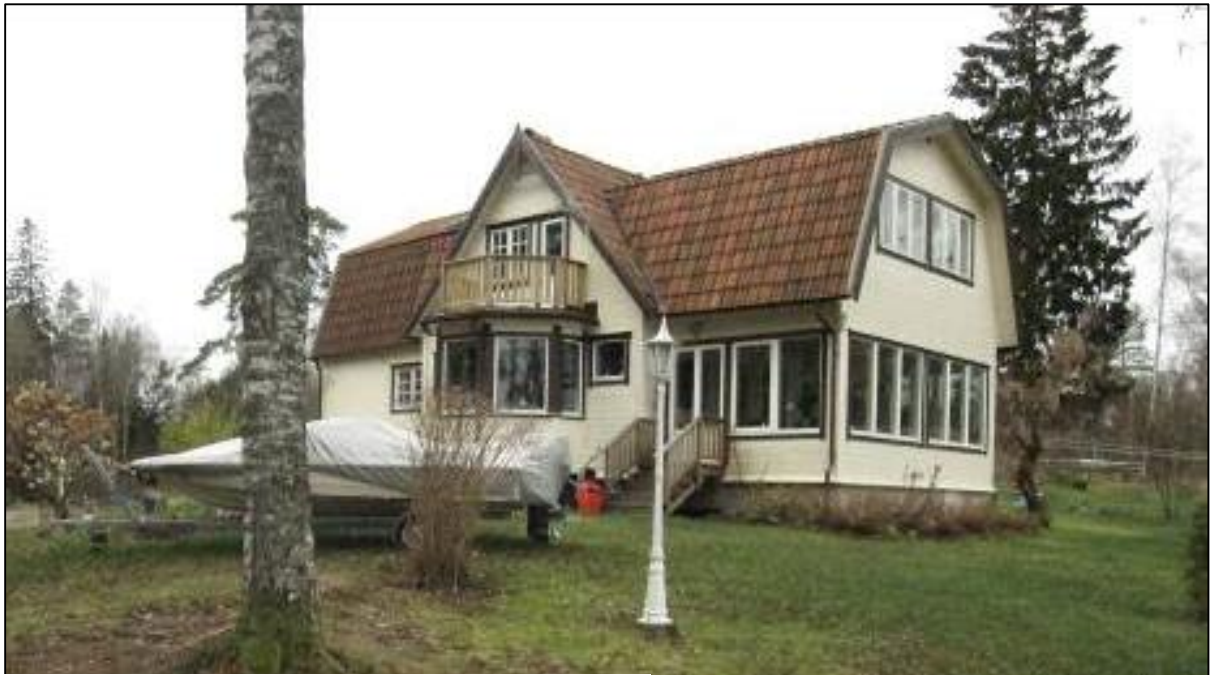
Bostadshuset står på en liten höjd i landskapet.

Fastigheten av stückades år 1915. I köpehandlingarna anges fastigheten som Solbacken och ny ägare var då Hjalmar Nilsson, Hindås. Ytterligare mark i söder tillköptes 1918 vilken fick namnet Solbacken 2 (Hindås 1:90) i köpehandlingar och lantmäteriförrättningen. Vid avstyckningen 1915 var fastigheten redan bebyggd. Byggnaden är förlängd åt öster i senare tid och hade tidigare formen av ett "T" och har genom tillbyggnaden fått en mer symmetrisk form.