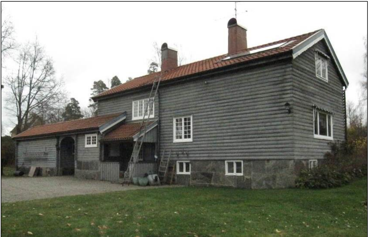
Annexets baksida med baksidan på "Lillstugan" längst till vänster i bild.