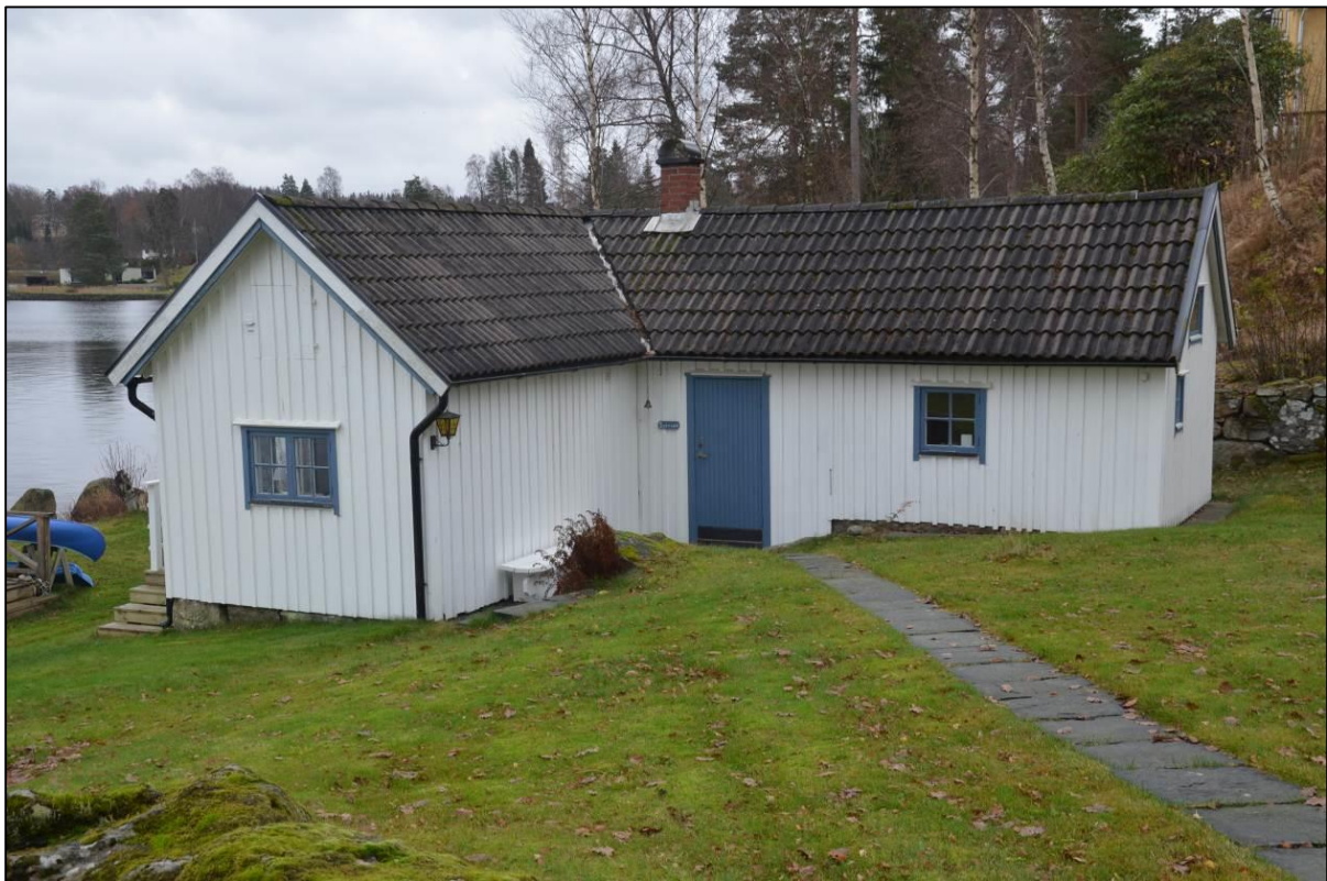
Den äldre stugan nere vid vattnet.