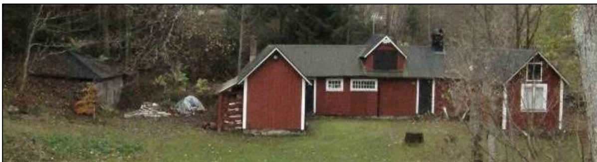
Üthus och stenkällare