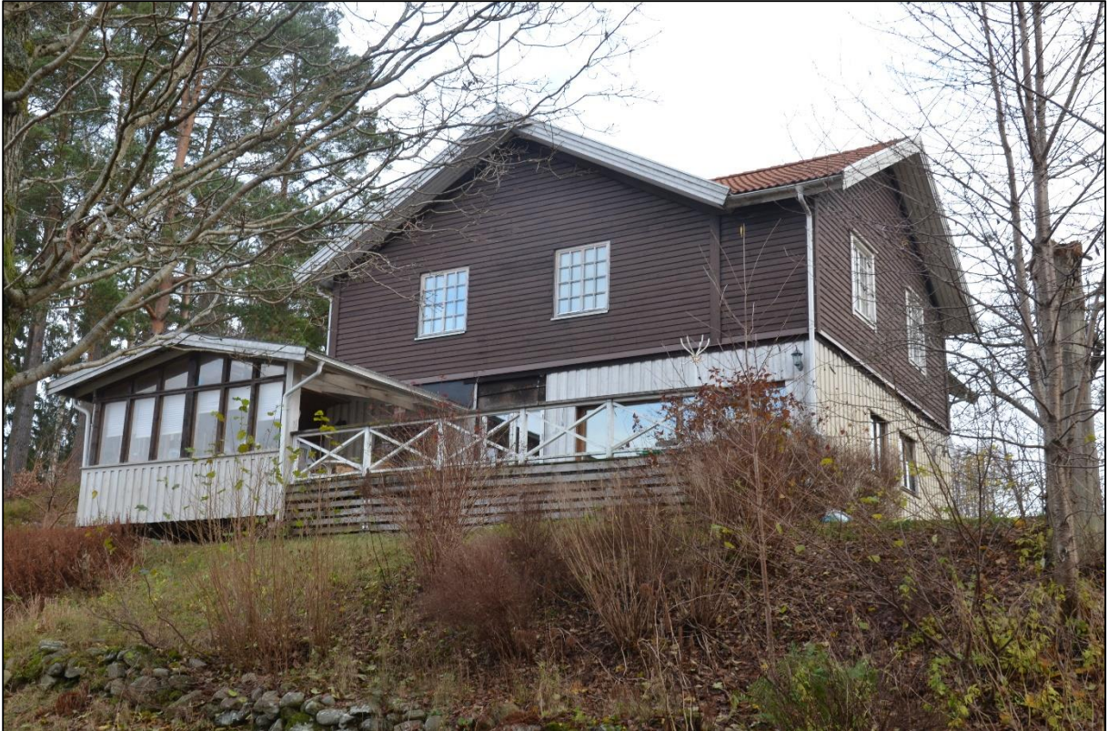
Bostadshuset sett från sjösidan. Närmast syns den senare tillbyggda glasade verandan.