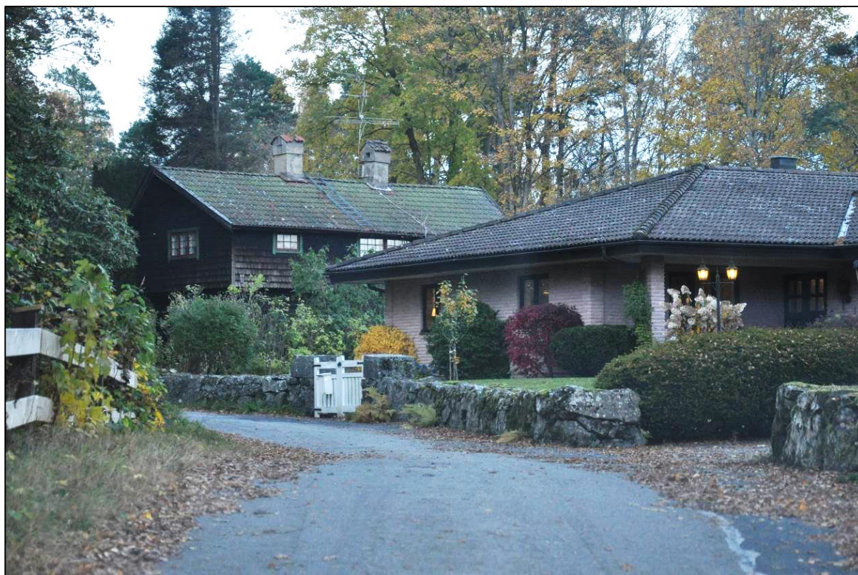
Villan från 1980-talet på en äldre tomt.

Fastigheten är belägen i den norra delen av Bocköhalvön med strandtomt och utsikt över Västra Nedsjön. Tomten är försedd med terrasseringar som sannolikt har tillkommit under 1910 -20-talet och här finns rester av en mindre stenbrygga. Strandskoningen är utförd i skiff-rad gnejs. Tomten bär idag prägel av en modern villatomt med gräsmatta och enstaka större träd. Fastigheten kantas mot Bockövågen av en låg stenmur.