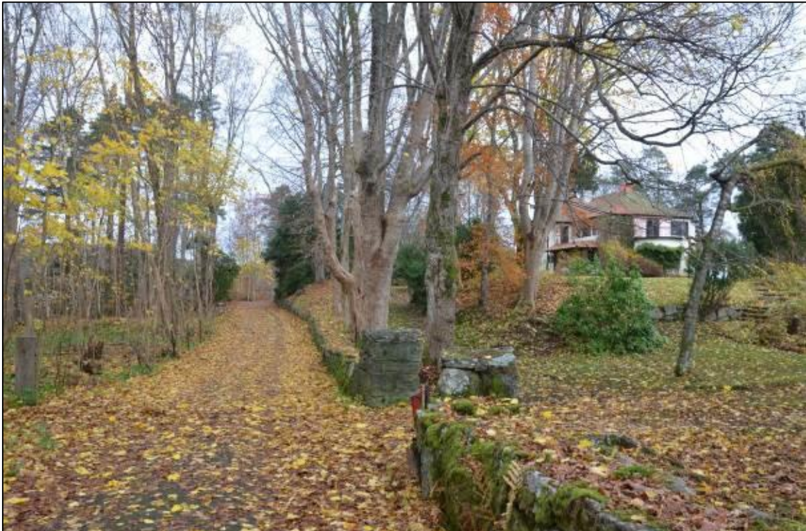
Väg kantad av vällagda stenmurar leder ut till nordspetsen av Bocköhalvön