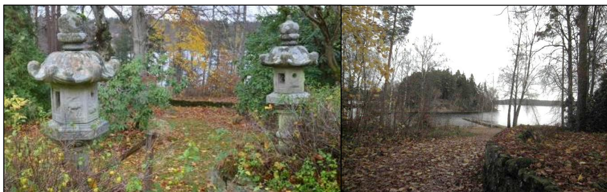
Trädgårdsdekorationer med kinesisk prägel