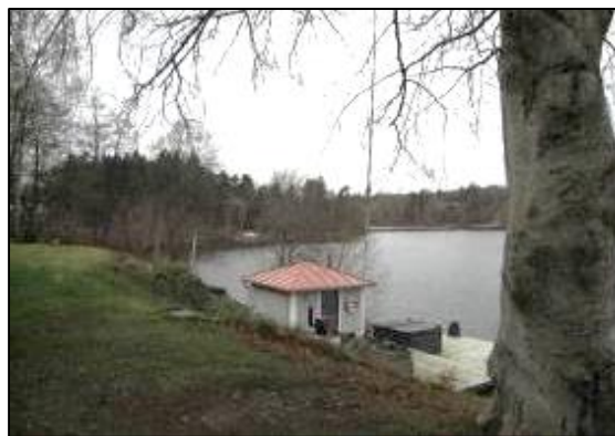
Villa och båthus