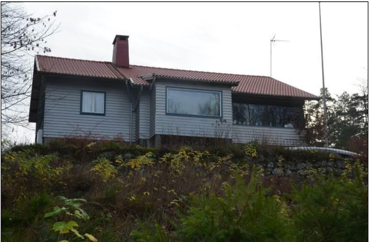
Fasaden åt sjösidan (nordväst).

Bostadshuset är en låg byggnad och uppförd i en våning. Grunden är av huggen sten med merparten av stora hällar som är råhuggna på utsidan. Byggnaden är uppförd i regelstomme och är utvändigt klädd med panel på förvandring, taket är täckt med röda betongpannor. Byggnaden är försedd med en loggia åt såväl sjösidan förlagd utmed hushörnet längst åt söder och invid denna ett frambyggt mittparti i en våning. Fönstren utmed gavlarna är kvadratiska med enkel spröjs i vardera fönsterlufterna samt försedda med fönsterluckor.