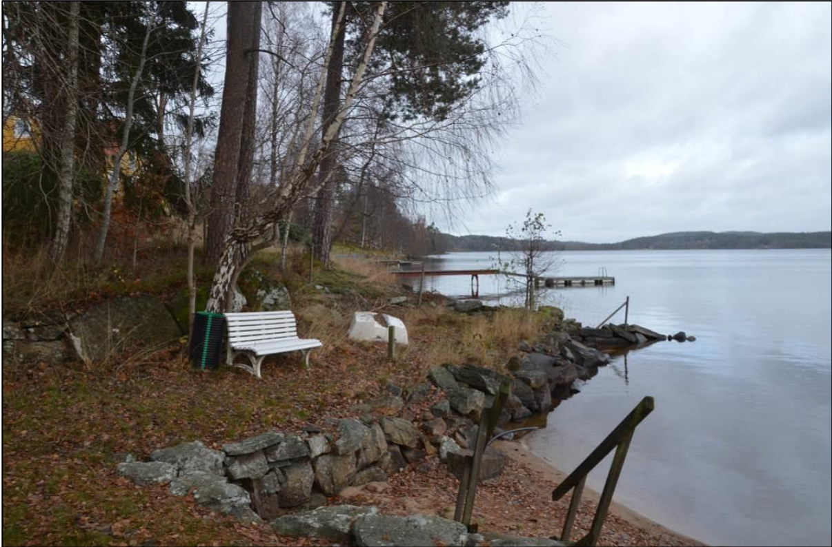
Strandskoningar och terrasser utmed stranden.