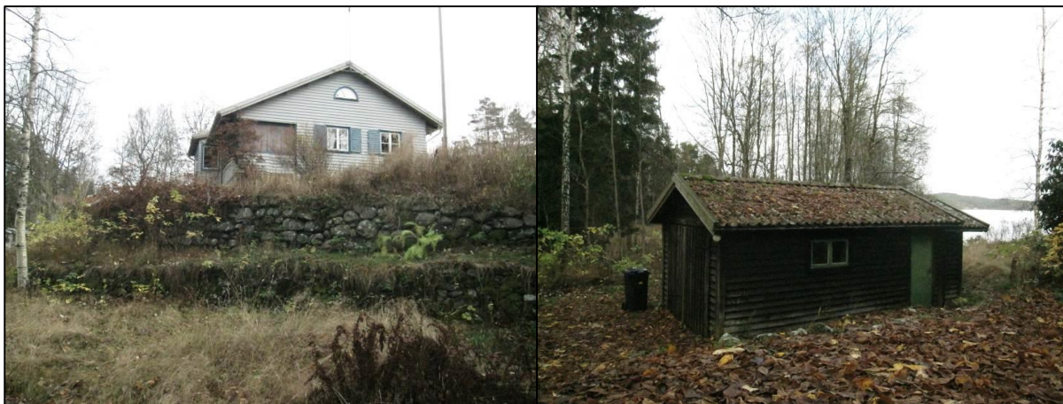
Stenterraseringar och en mindre garagebyggnad.

Fönstren utmed långsidorna är ospröjsade fönster, tvåluftsfönster samt perspektivfönster vilka sannolikt tillkommit under perioden 1950-1960. Gavelröstena är försedda med lunettefönster utmed båda sidorna. Byggnaden är målad i ljusblå kulör med mörkare blå kulör i fönsterfoder samt en ljusare kulör på fönsterluckorna. Fönsterbågarna är vitmålade. Loggian var vid investeringstillfället försedd med väderskydd i form av träluckor.