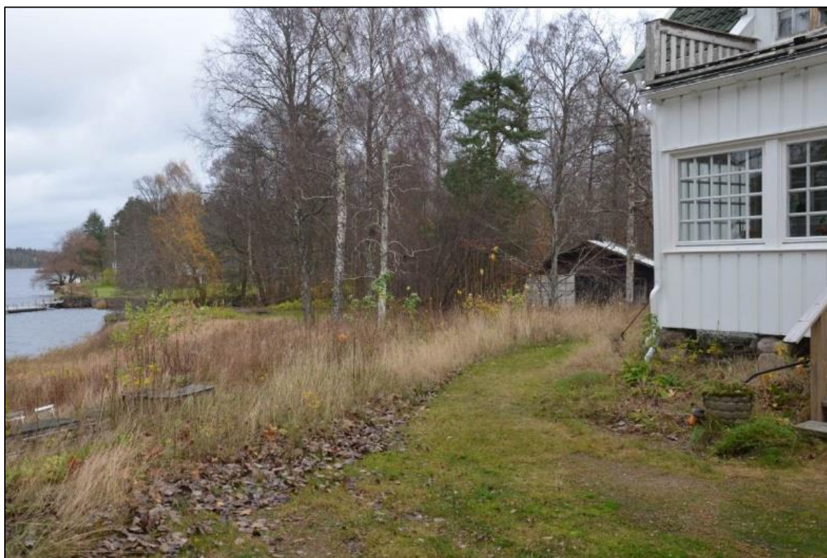
Sjötomt på halvöns västra sida.

Tomten består av två skilda fastigheter, fastigheten Hindås 1:77 är bebyggd med bostadshuset medan övriga byggnader såsom stall, garage redskapsbod och vedbod är belägna på fastigheten Hindås 1:81. Mot sjösidan finns en fornlämning i form av en boplats från mesolitisk tid.