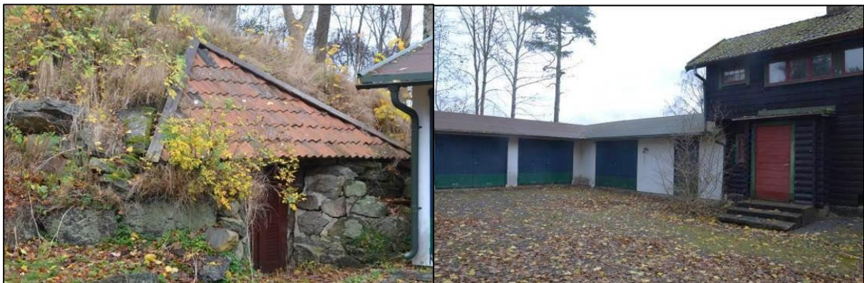
Stenkällare på tomtens norra del

Brunnen med brunmålade träpelare med vikingainspirerat mönster och den naturstensmurade källaren utgör även viktiga inslag i miljön.