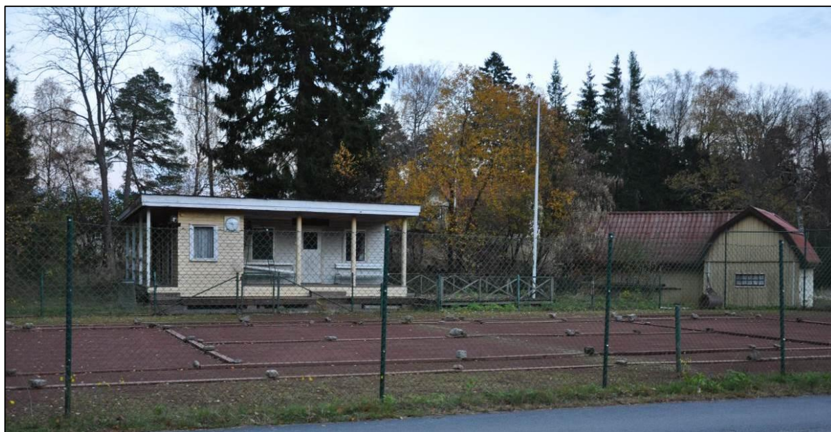
Tennisbanan med klubbstuga sedd från väster.

Tennisbanor med klubbstuga för omklädningsrum och funktionärer. Tennisanläggningen ligger centralt på halvön på gemensam mark.