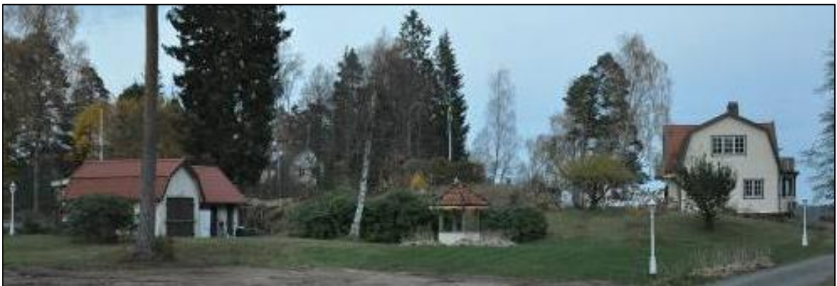
Garage, brunn och bostadshus

Fastigheten är belägen på halvöns östra sida på en stor tomt som sträcker sig från Bockövägen och ut till strandkanten i öster. På fastigheten finns förutom ett bostadshus ett garage, ett båthus samt en lillstuga. På tomten finns också en brunn med pelare av trä som bär upp ett tak täckt med enkupigt lertegel.