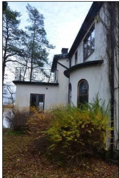
T.h: Östra fasaden sedd från norr.