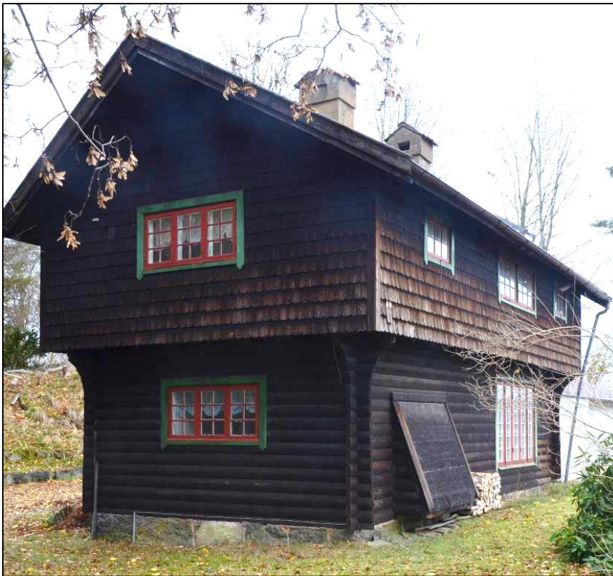
"Loftbod" med spånklädd övervåning och rundtimrad bottenvåning