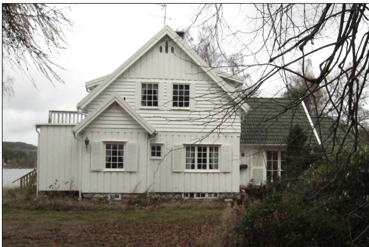
Bostadshusets gavel åt söder.

Bostadshuset är uppfört i trä, sannolikt med en stomme av liggande plank. Byggnaden står på en låg gråstensgrund. Utvändigt är huset klätt med lockpanel samt på övervåningen omväxlande panel på förvandring och lockpanel. Den avancerade panelklädseln är karaktäristisk för byggnaden. Huset har flera mindre utbyggnader som kan vara från husets tillkomsttid eller från tillbyggnaden några år därefter, däribland ett burspråk åt norr. Byggnaden är tillbyggd i flera skeden i form av utbyggnader i rad åt baksidan. Tillbyggnaderna är tydligt avläsbara som enskilda byggnadskroppar. Åt sjösidan finns en större glasad veranda. Denna byggdes om från att tidigare varit en öppen veranda under 1960-talet och erhåll då sina nuvarande pivothängda fönster.