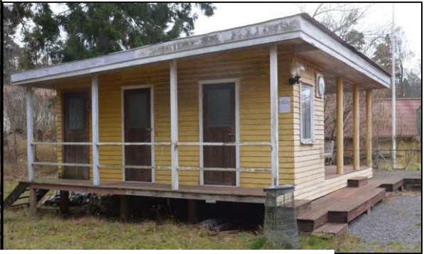
Klubbstugan från norr