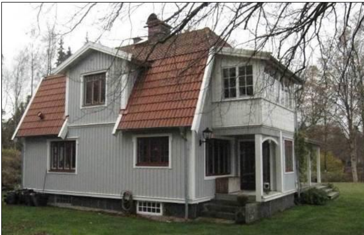
Villa Bokelid från norr.

Sommarvillan är uppförd 1913-1914. Villan är ursprungligen nationalromantisk till sin karaktär men har genomgått en del förändringar sedan tillkomsttiden, i form av bland annat tilläggsisolering. Villan var i originalutförande faluröd med stående panel. Senare förändringar är en entré åt sydost samt en öppen veranda åt nordväst vilka tillkom 2004. Villan går under namnet Bokelid.