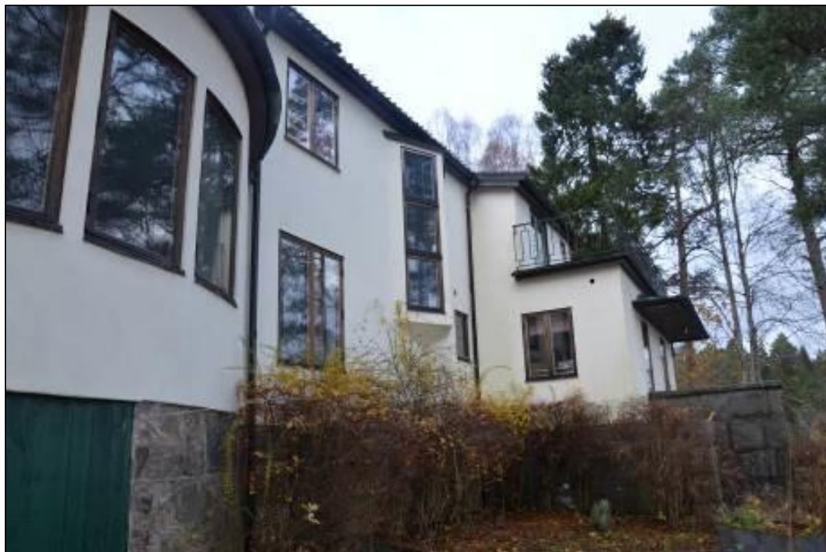
Fasaden sedd från östra sida

är till exempel ett karakteristiskt drag att beakta. Byggnaden är en unik och särpräglad villa- byggnad med ett mycket högt kulturhistoriskt värde.