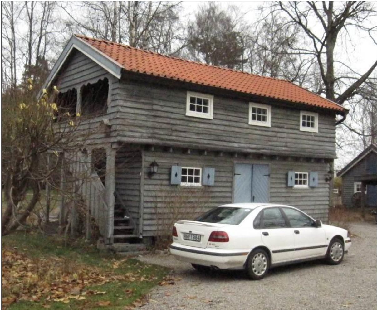
Magasinet, beläget i den norra delen av fastigheten och byggdes som sommarbostad och förråd.