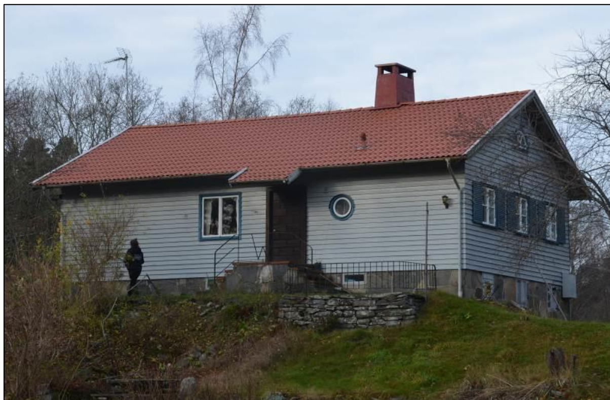
Fasaden från nordost