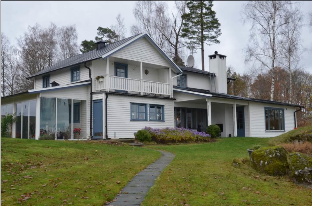
Bostadshuset sett från sjösidan.