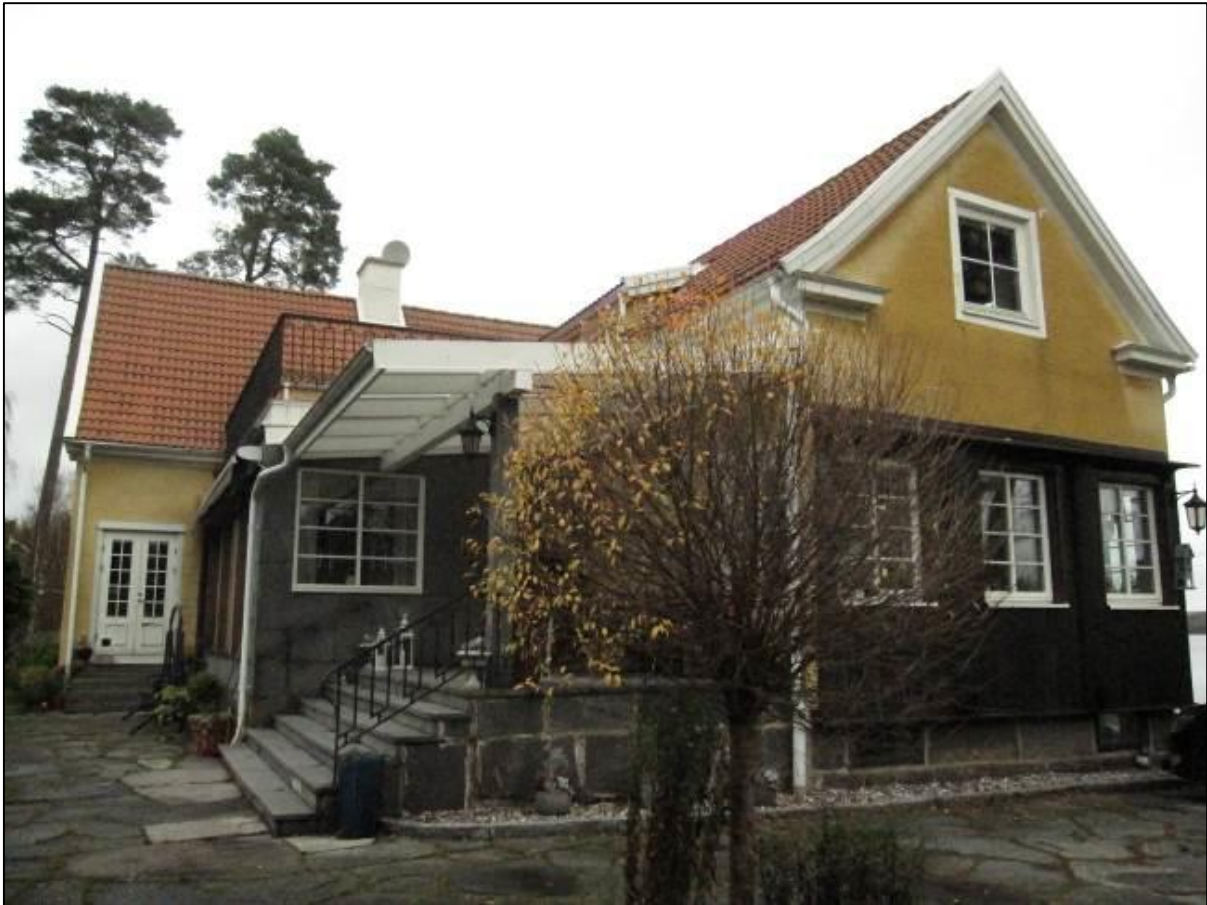
Bostadshuset från söder.