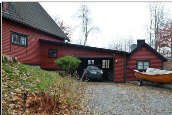
Byggnaden till höger, en f d. tvättstuga har sammanbvaats med bostadshuset