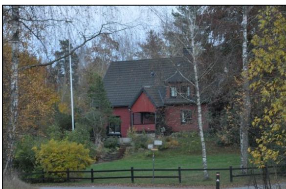
Tomt och bostadshus från väster

Bostadshuset är uppfört i en och en halv våning. Grunden är en stengrund med murad fältsten. Byggnaden är uppförd med resvirkesstomme och är utvändigt klädd med stockpanel. Fasaden är målad i en faluröd färgnyans men med en täckande oljefärg medan fönstren, såväl bågar som foder, är målade i svart. Taket är ett sadeltak täckt med svarta betongpannor. Utmed båda takfallen finns taklyft vilka båda är placerade i den södra halvan av byggnaden. Mitt på långsidan åt väster finns en stor öppen veranda/förstukvist. Utmed gaveln åt söder finns en mindre utbyggnad med balkong över och som avslutas i bakkant med en loggia. Utmed långsidan i öster finns ett tillbyggt garage samt en mindre komplementbyggnad.