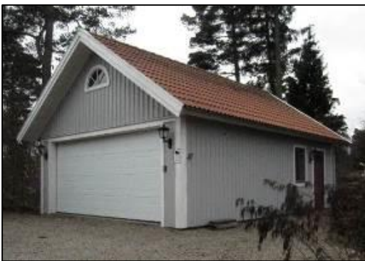
Garage på tomten och intill vägen

Bostadshuset är en god representant för det tidiga 1900-talets mer exklusiva villastilar med prägel av jugend och nationalromantik. Villan är relativt välbevarad från tillkomsttiden trots senare tids fasadändring och tillbyggnader. Villan har tillsammans med uthusbyggnaden ett stort kulturhistoriskt värde.