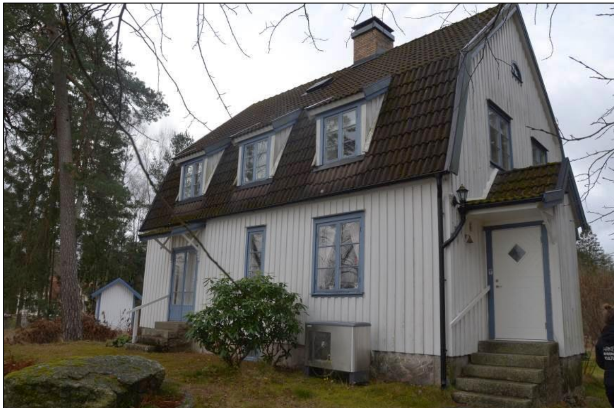
Sommarvilla från sydväst.

Fastigheten består av ett boningshus och ett garage belägna på en höjd med en egen strand nedanför. Högresta tallar och rododendron pryder trädgården och på strandtomten finns strandskoningar av sten.