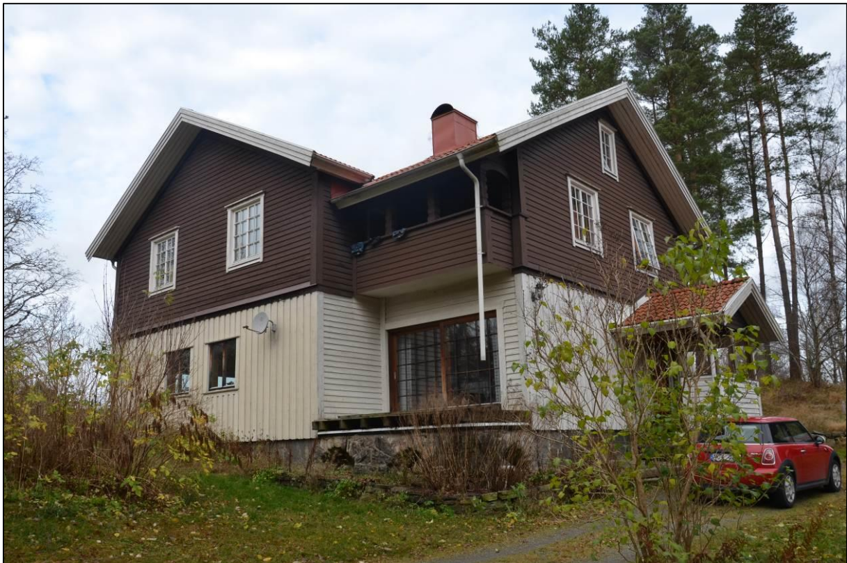
Bostadshuset sett från sydost.

sedan tillkomsttiden. Byggnaden har i senare tid erhållit en ny fasad av stående vitmålad lockpanel i nedervåningen och en liggande panel, panel på förvandring som är brunmålad i övervåningen. Taket är ett sadeltak belagt med rött betongtegel. Ett mindre taklyft med sadeltak finns utmed långsidan åt norr och under denna en grund utbyggnad i övervåningen vilken möjligen ha haft sitt ursprung i en tidigare loggia. Utmed samma fasad mot norr samt frambyggd mot sjön åt väster finns en modern glasad veranda försedd med pulpettak och sadeltak i sin västra del täckt med korrugerad plåt. Denna är byggd på betongplintar och i likhet med nedervåningen i övrigt panelad med lockpanel samt vitmålad. En förstukvist är utbyggd utmed gaveln åt öster. Fönstren är moderna varav nedervåningens är brunbetsade lackade träfönster medan övervåningens fönster är pivohängda med utanpåliggande spröjs. Kvar från tillkomsttiden är en loggia förlagd åt söder där ursprungliga snickerier i form av snidade bärande stolpar bär upp taket.