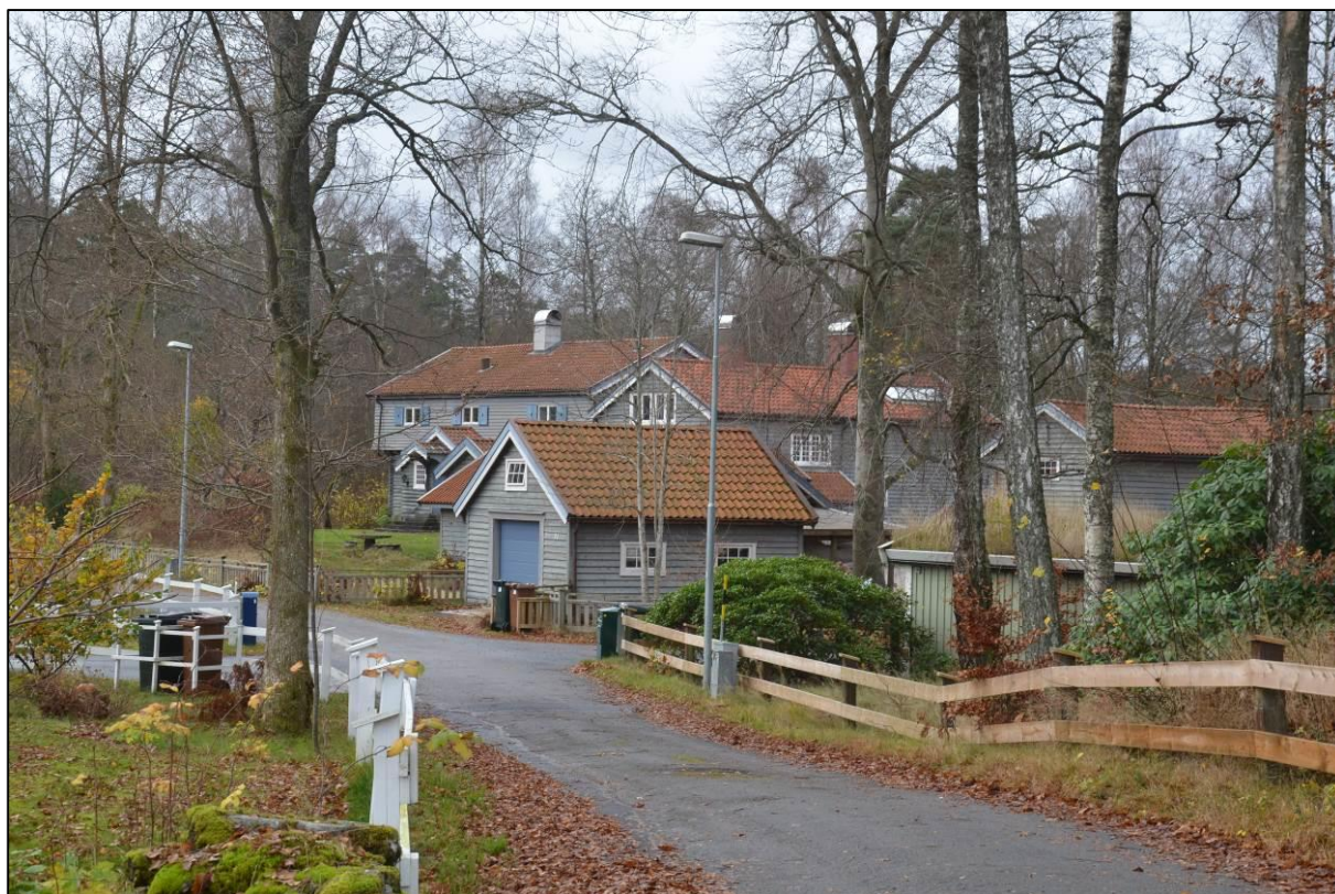
Fastighetens byggnader från Bockövägen (nordost).

Fastigheten är belägen i ett plant och relativt öppet område i norra delen av Bocköhalvön. Tomten är relativt stor och bebyggd med fler byggnader vilka till skillnad från flertalet äldre hus inte ligger förlagda i anslutning till stranden.