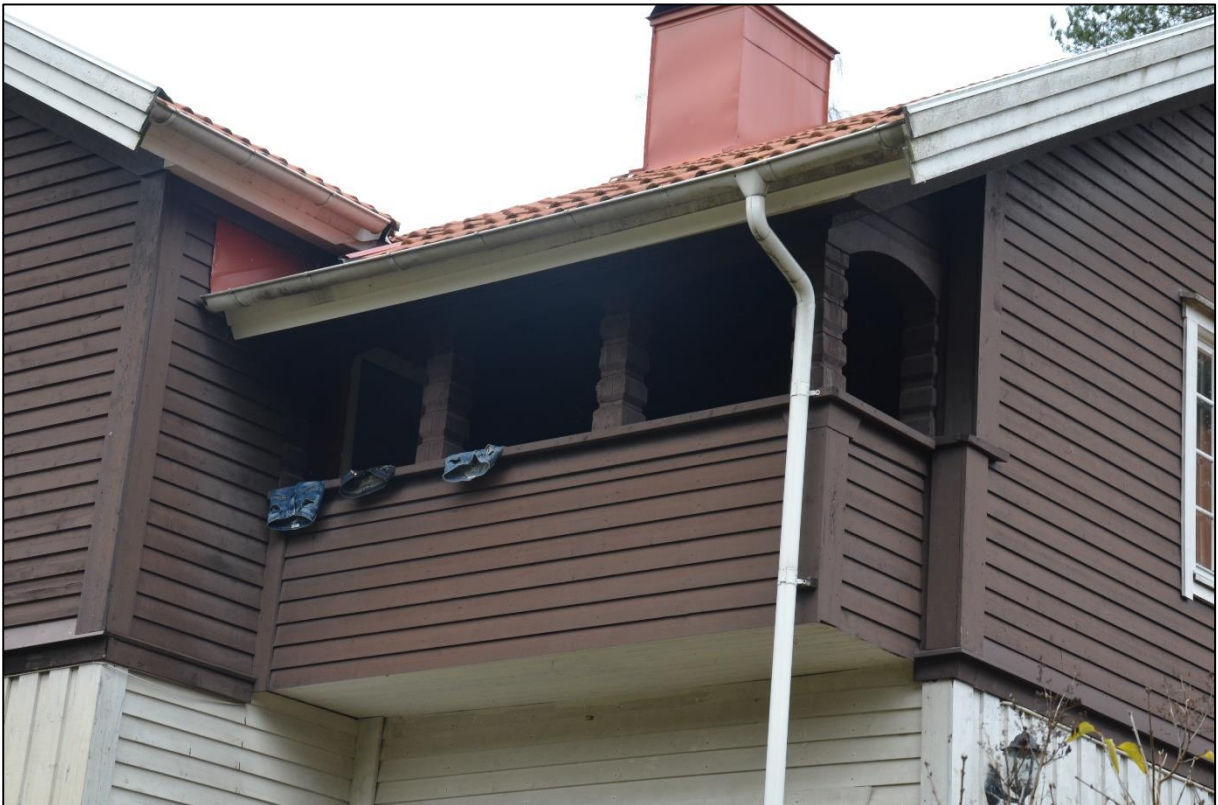
Loggian åt söder