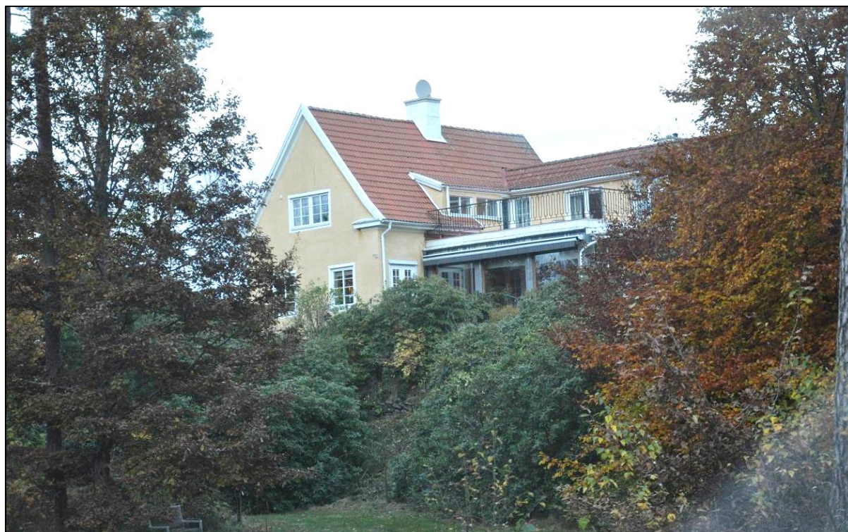
Det putsade bostadshuset omgärdas av träd och buskar.

Fastigheten ligger på krönet av en naturlig höjdrygg i landskapet. Den kuperade trädgården med gräsmattor och berg i dagen är bevuxen med högresta tallar, lövträd och buskar. Fastigheten är bebyggt med ett bostadshus högst uppe på kullen samt ett garage och uthus nedanför invid Bockövägen.