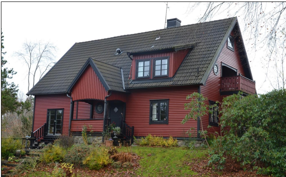
Bostadshuset från sydväst.