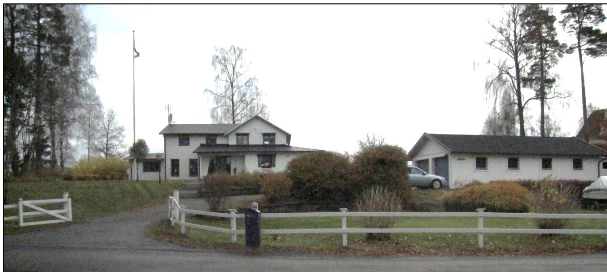
Fastigheten sedd från Bockövägen (väster).

Bostadshuset är beläget utmed Bocköhalvöns östra strand på en höjd i landskapet på en stor tomt med gräsmattor och enstaka träd och buskar samt terrasseringar. På tomten finns ett större bostadshus beläget centralt på tomten samt ett mindre bostadshus beläget invid sjökanten och vid infarten finns en garagebyggnad.