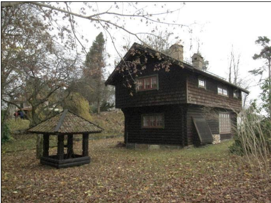
Stugan med den karaktäristiska brunnen