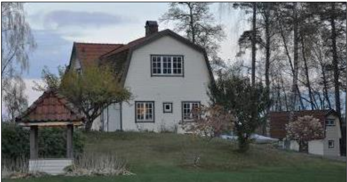
Den tillbyggda delen åt nordost med tätt sittande fönster mot sjösidan.