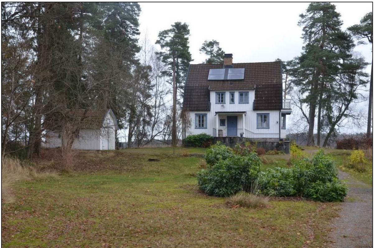
På den stora tomten växer tallar och rhododendron