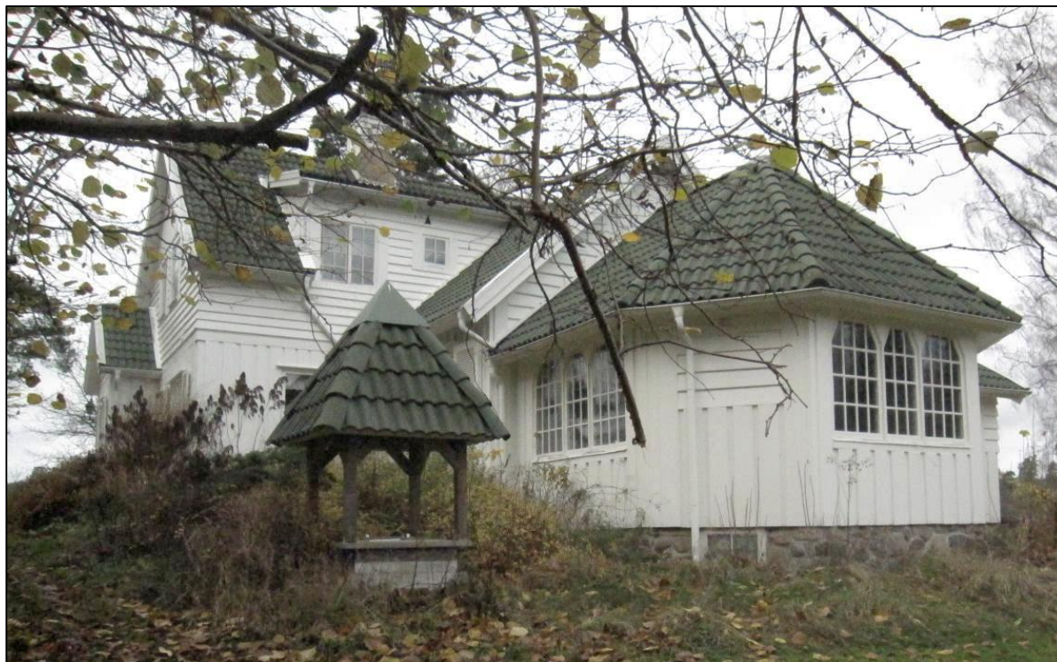
Bostadshuset från sydost. Brunnen utgör ett karaktäristiskt inslag i miljön

Brunnen med dess nationalromantiska utformning.