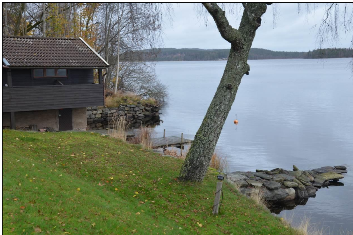
Sjöstugan med en stenbrygga nedanför

Det nya bostadshuset på fastigheten liksom garaget är däremot moderna inslag som inte anspelar på det traditionella villabyggande som präglar merparten av villorna i denna norra del av Bocköhalvön.