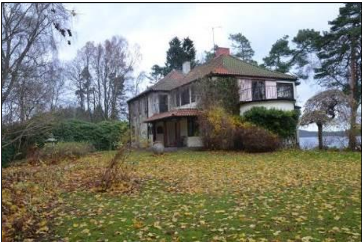
Villan och trädgården från söder

Tomten sträcker sig upp till Bocköhalvöns nordligaste spets. Vägen här är kantad av lövträd och vällagd stenmur. Högresta tallar växer mot sjösidan. På fastigheten intill (Hindås 1:80) uppfördes en stuga med nationalromantisk karaktär (se nedan).