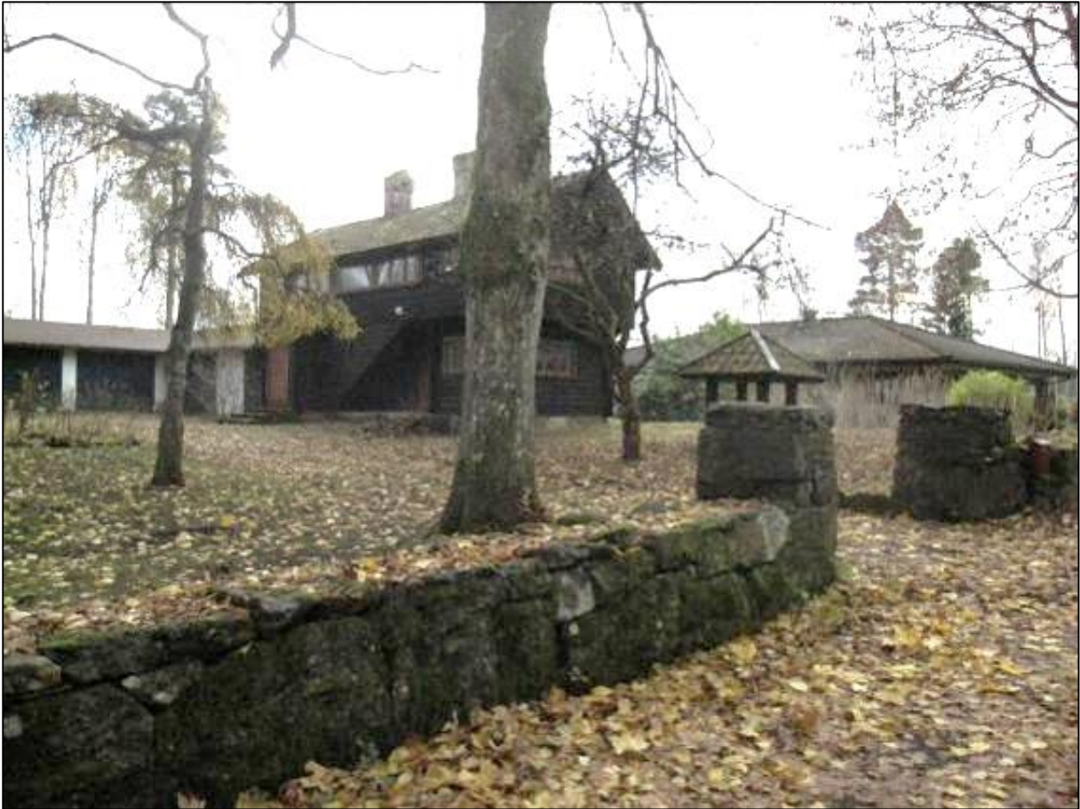
Tomten kantas av stenmurar mot Bockävägen