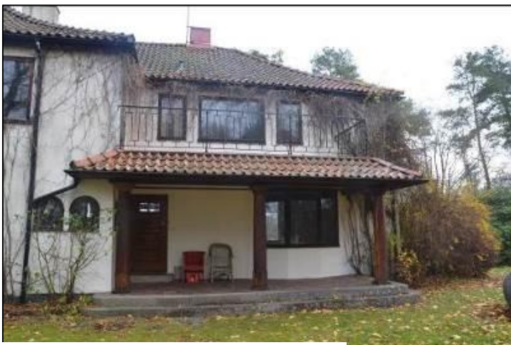
Ovan: Huset i trädgården från sydväst.

Byggnaden har en särpräglad utformning med inslag av funktionalism, exempelvis i de rundade burspråken med höga fönster i rad. Andra delar av byggnaden för mer tankarna till 1920-tals klassicism med de pagodlika svängda takfallen och rundade fönsterbågar. Det är 1940-talets ombyggnad som starkast präglar den byggnad vi ser idag. Fönsterbågarnas mörka färg