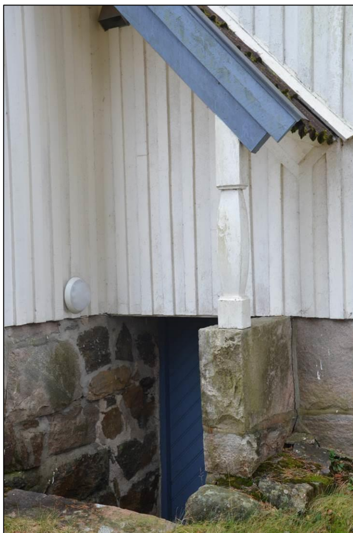
Utsirad pelare -en bevarad äldre byggnadsdetalj

Det lätt svängda mansardtaket, grunden av natursten, lunettefönster under takåsen, en utsirad träpelare. Fönstersättning och fönsterutformning. Garagebyggnaden med dess utformning med anspelning på bostadshuset.