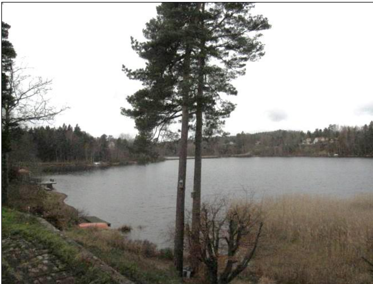
Utsikt från tomten mot Takkulla i väster.