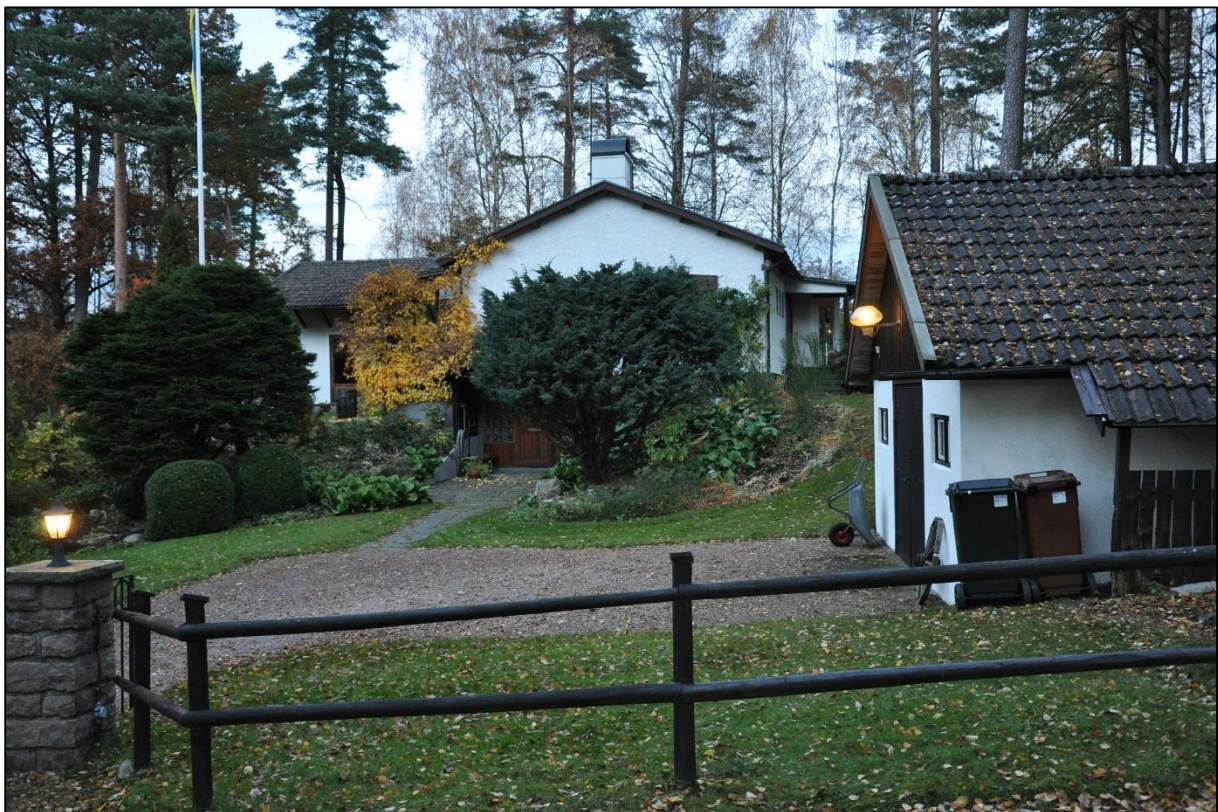
Bostadshuset med dess äldre byggnadsdel i mitten och med en utbyggnad till vänster i bild. I förgrunden en garagebyggnad.

Bostadshuset är uppfört i en våning och byggd i souterräng med inredd källarvåning med entré. Byggnaden är uppförd i tegel och är utvändigt putsad med spritputs. Taket är ett flackt sadeltak täckt med betongpannor.