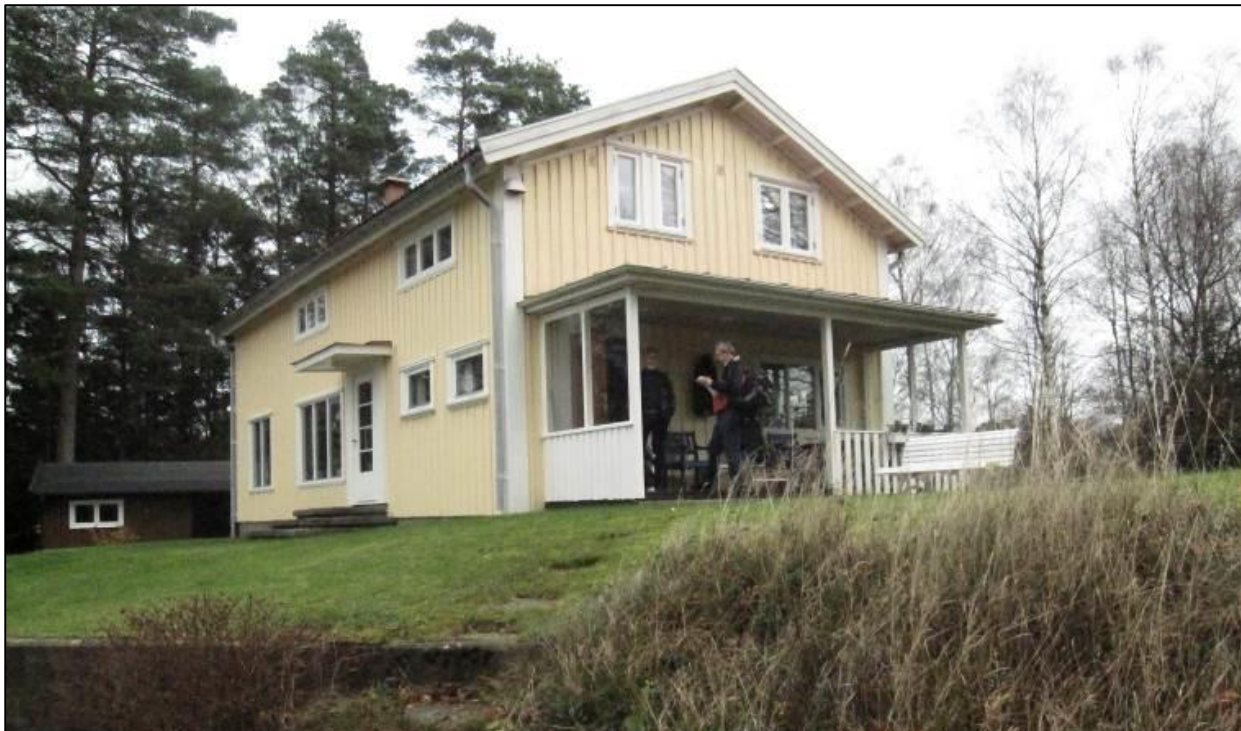
Bostadshusets fasader åt söder och väster ligger högt