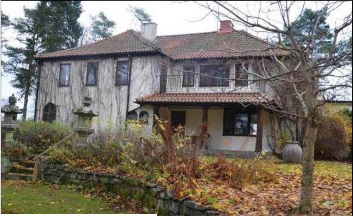
Trädgården med dess terrasseringar.