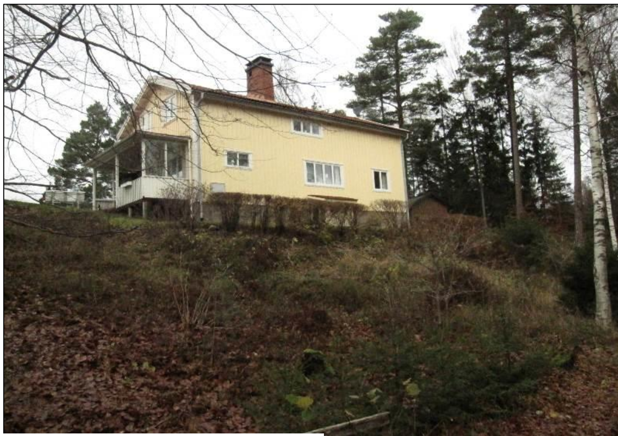
Bostadshuset sett nerifrån Fjellstedtsvägen

Fastigheten är belägen på en smal och brant åsrygg mellan Fjellstedtsvägen och Västra Nedsjön på Bocköhalvöns västra sida. Utmed den västra delen av tomten har marken stagats upp med en modern stödmur i betong. Tomten är till övervägande del en utpräglad skogstomt.