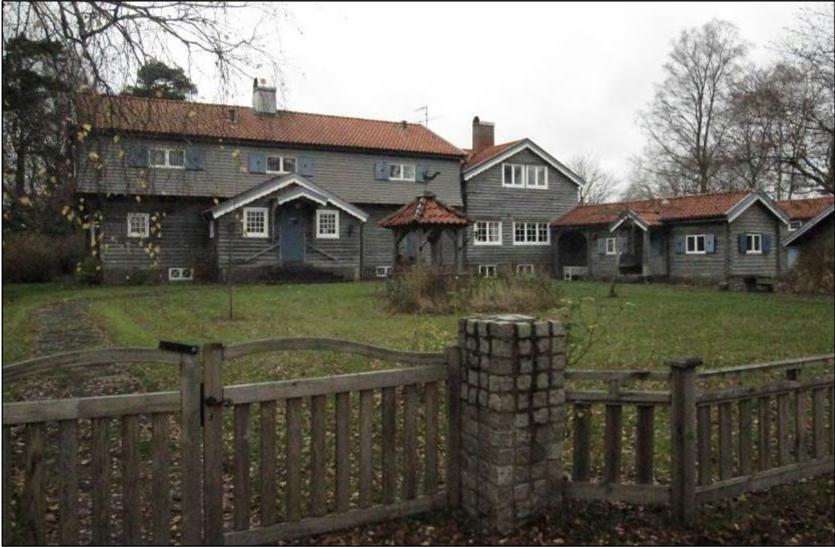
Miljön från Bockövägen (öster)