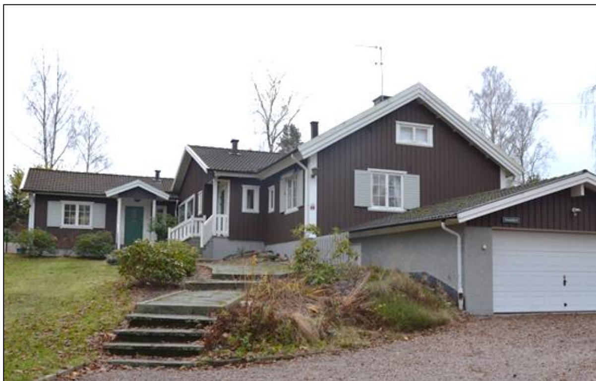
Fastighetens byggnader från norr. Det äldsta huset är huset längst till vänster i bild.

Fastigheten är avstyckad år 1936 och som köpare till den nybildade fastigheten står Clas Carling. Sannolikt uppfördes kring samma tid ett mindre bostadshus som troligen motsvarar den sydligast belägna byggnadsdelen. Övriga delar av huset har byggts till i flera etapper därefter.