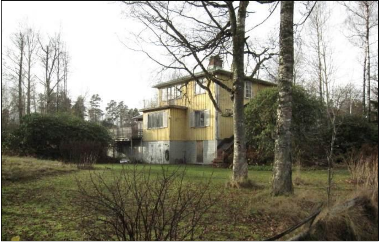
Högsta björkar på gräsmattan framför det funktionalistiska bostadshuset.