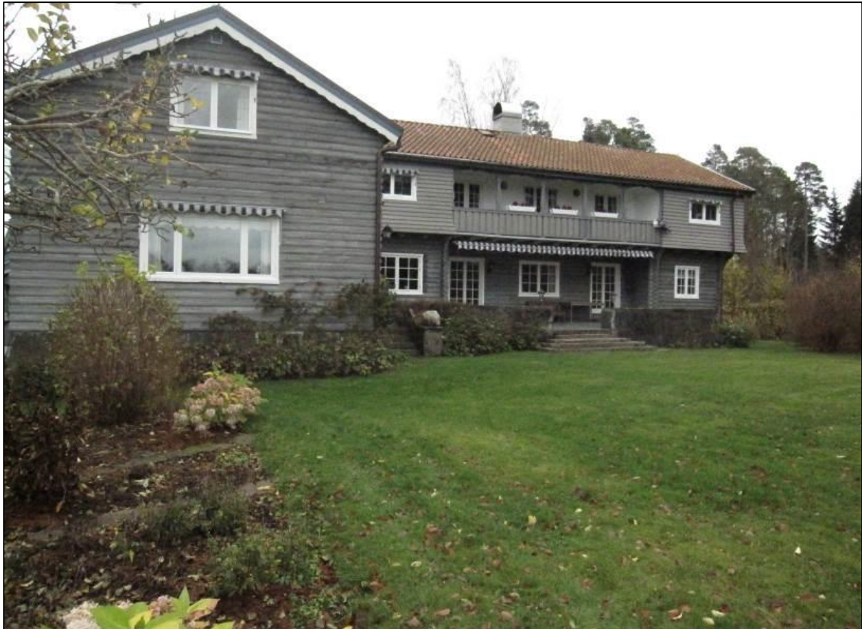
Det större huset från år 1920 till vänster i bild samt "Annexet" från år 1936 till vänster.

De mindre byggnadernas fasadutformning med liggande panel eller med exponerat liggtimmer. Husens karaktäristiska fönstersättning samt fönsterutformning.