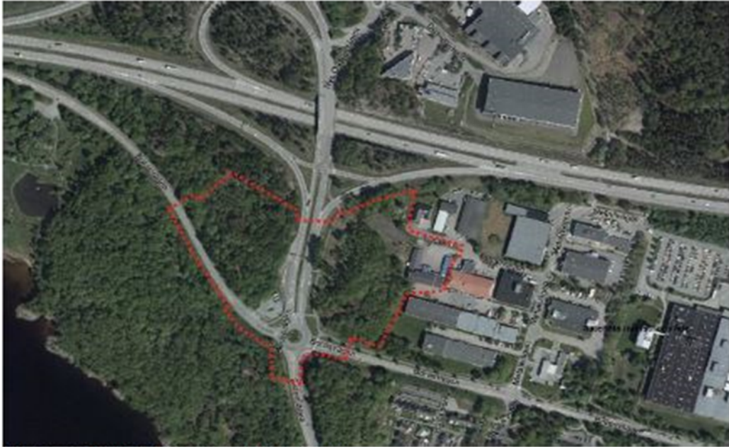
Figur 1 - Ortofoto med markering av planområdet