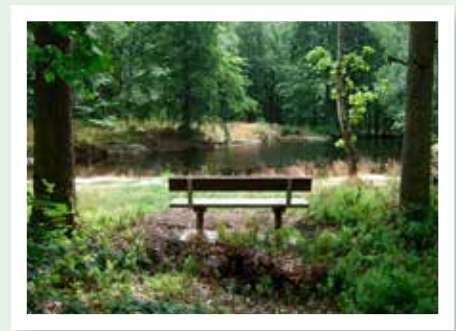
Vy över Guld-fisk-dammen.