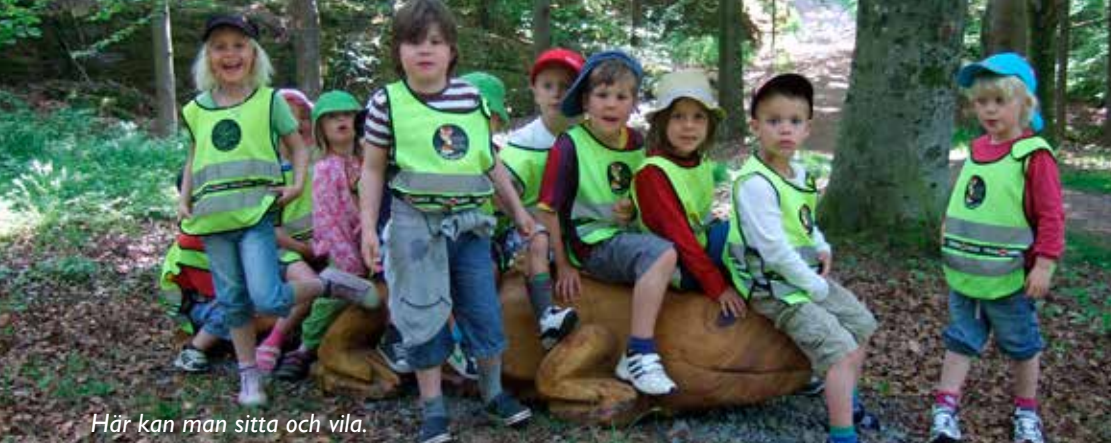
Här kan man sitta och vila.