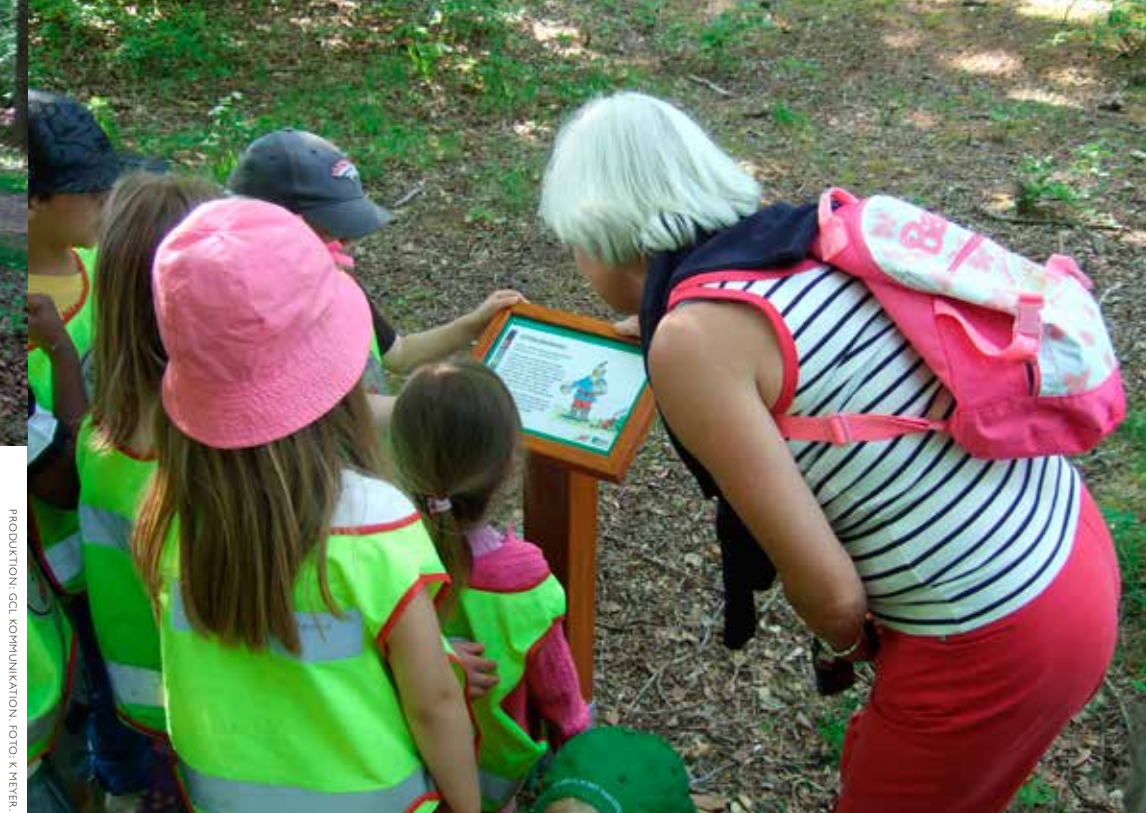
PRODUKTION: GCL KOMMUNIKATION; ILLUSTRATIONER: P. HENRIKSSON; TRICK: DANAGÅRD LITHO; ODESIK: 2013