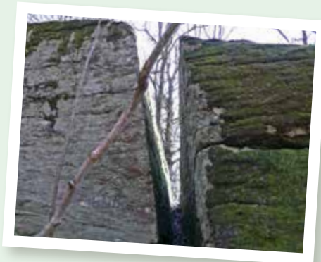
Sprickan i berget kallar barnen Helvetes-gapet. Här kan bara barn passera.

Utmed naturstigen finns vägvisnings-skyltar i form av barnteckningar, informationstavlor, en liten akti-vitetsbana och två träskulpturer: en kattuggla och en två meter lång vattensalamander.