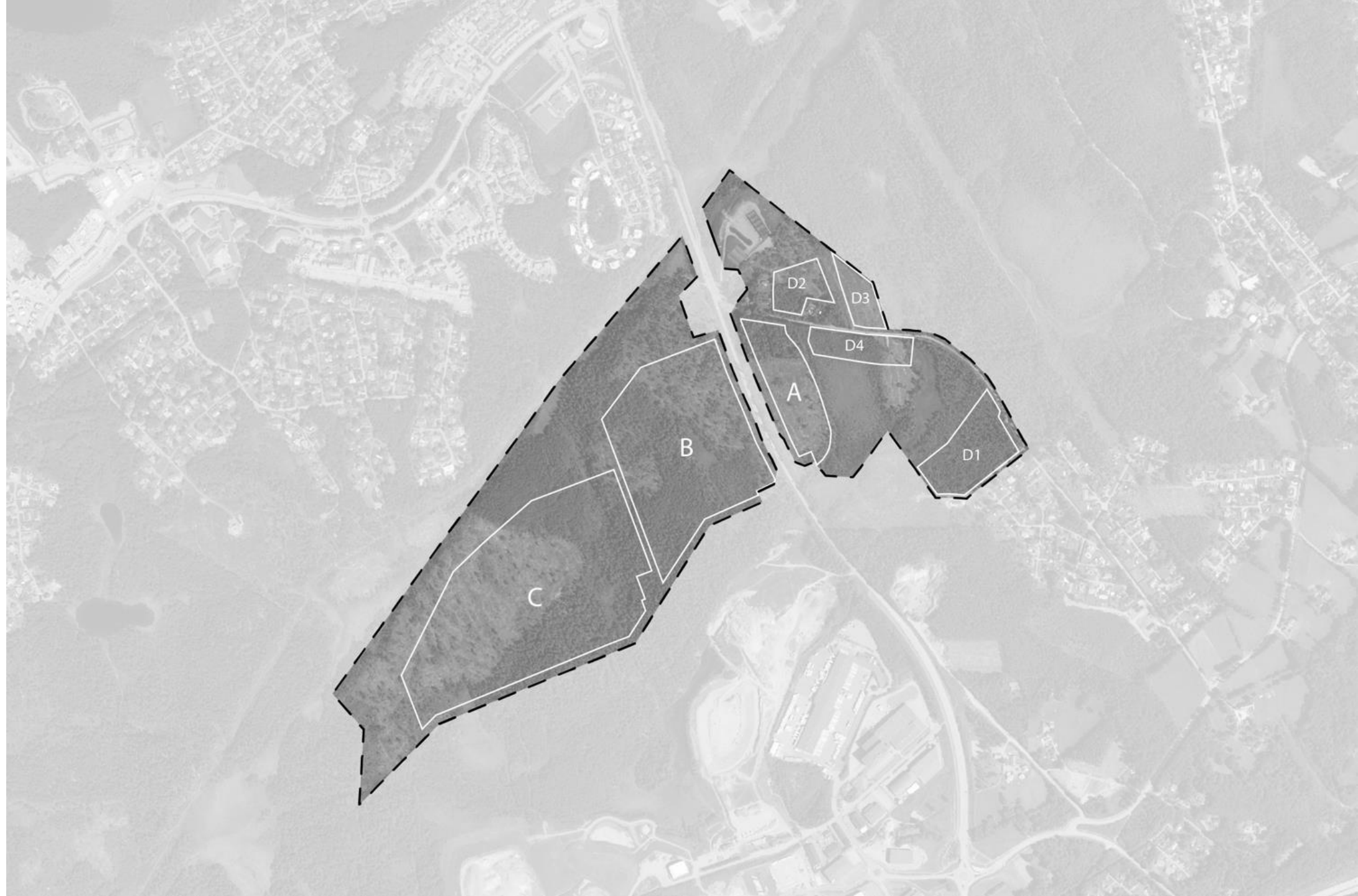
Figur 1. Planområde för Link40 med dess delområden.