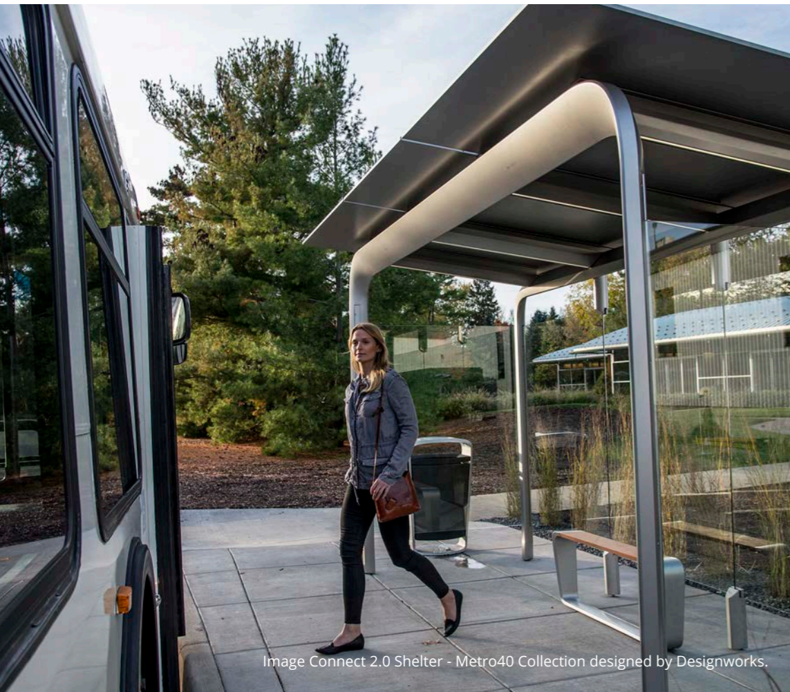
Image Connect 2.0 Shelter - Metro40 Collection designed by Designworks.