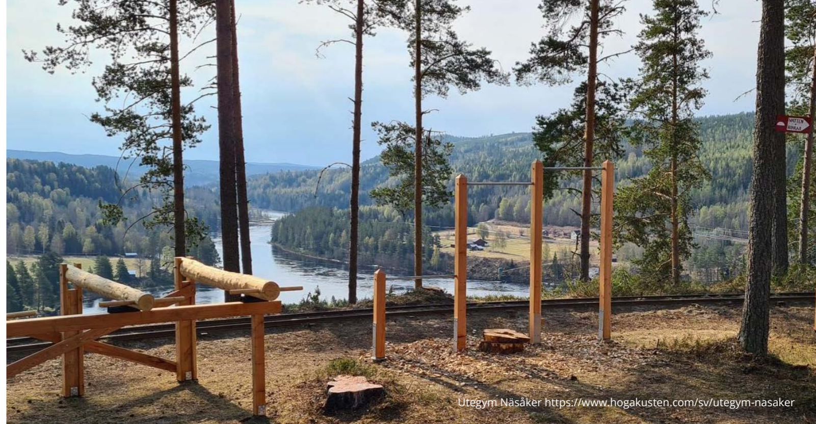
Utegyms Näsåker https://www.hogakusten.com/sv/utegym-nasaker

En högkvalitativ simhall anläggs i anslutning till Landvetter Lodge. Den utformas som en utmärkande del av besöksmålet Nature Awareness. Simhallen attraherar tävlingar och cuper och är ett självklart besöksmål för alla Härrydabor.