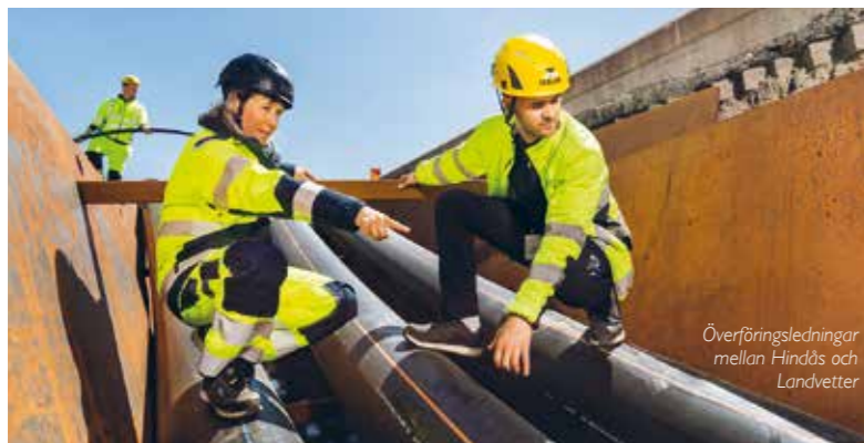
Överföringsledning mellan Hindås och Landvetter