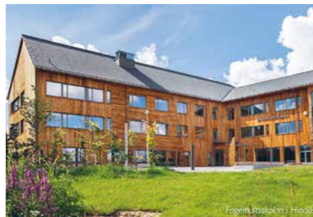
Fagerhultsskolan i Hindås

Härryda tog hem silverplatsen i kommunrankningen Årets superkommun 2021. Bakom rankningen står tidningen Dagens Samhälle som jämfört alla 290 kommuner utifrån olika parametrar. Vann gjorde Mölndals stad.