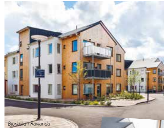
Björkelid i Rävlanda

Lagom till höstterminen stod Fagerhultsskolan klar. Skolan rymmer 450 elever i årskurs fyra till nio och ligger naturskönt i Hindås. I Landvetter centrum öppnade Landevi servicebostad under hösten. Boendeformen vänder sig till personer som med stöd och hjälp av personal kan klara av ett eget boende.