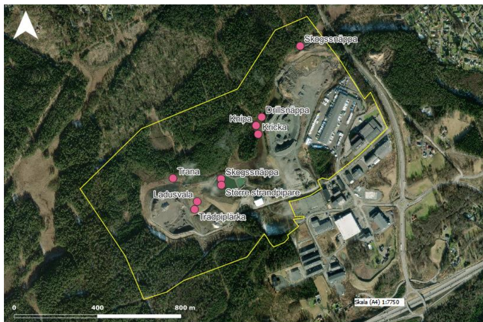
Figur 3. Visuella observationer inom området av fågelarter som noterats utöver revirkarteringen.

Ett fåtal observationer av särskilt skyddsvärda arter noterades som antingen är upptagna i bilaga I i Europaparlamentets och Rådets direktiv 2009/147/EG (fågeldirektivet) eller som finns med på den svenska rödlistan. Dessa utgörs av drillsnäppa ( Actitis hypoleucos NT ), kricka ( Anas crecca VU ) och trana ( Grus grus ). Utöver ovan listade arter påträffades även skogssnäppa ( Tringa ochropus ), knipa ( Bucephala clangula ), större strandpipare ( Charadrius hiaticula ), ladusvala ( Hirundo rustica ) och trädpiplärka ( Anthus trivialis ).