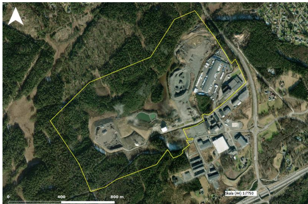
Figur 1. Karta över fastigheten Håltås 1.8, Härryda kommun. Fastighetsgränsens utbredning (gul linje) är ungefärlig

Undersökningen som ligger till grund för denna PM har fokuserat på särskilt skyddsvärda arter i form av fåglar upptagna på den svenska rödlistan samt eller i bilaga 1 till Europaparlamentets och Rådets direktiv 2009/147/EG av den 30 november 2009 om bevarande av vilda fåglar (hädanefter benämnt som fågeldirektivet). Nedan redovisas den metod som använts vid genomförd undersökning, de resultat som föreliggande undersökning resulterat i samt en kort diskussion kring deras innebörd för detaljplanens omfattning.